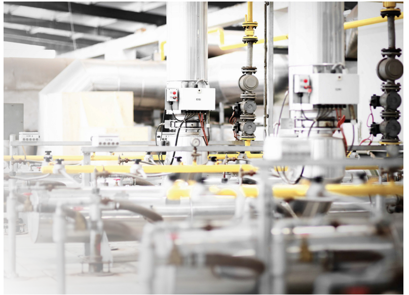
Brennergruppe auf einem LINGL-Ofen