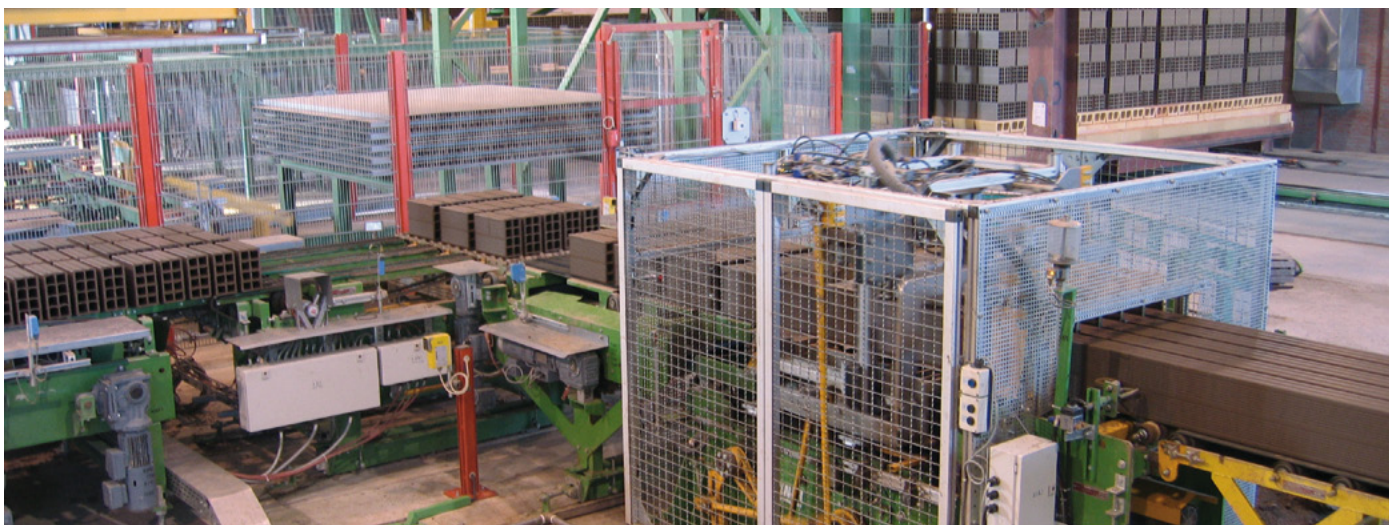
Circuit des produits verts Wet side