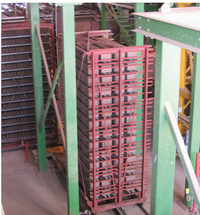
Installation de transport – séchoir Transport system – dryer