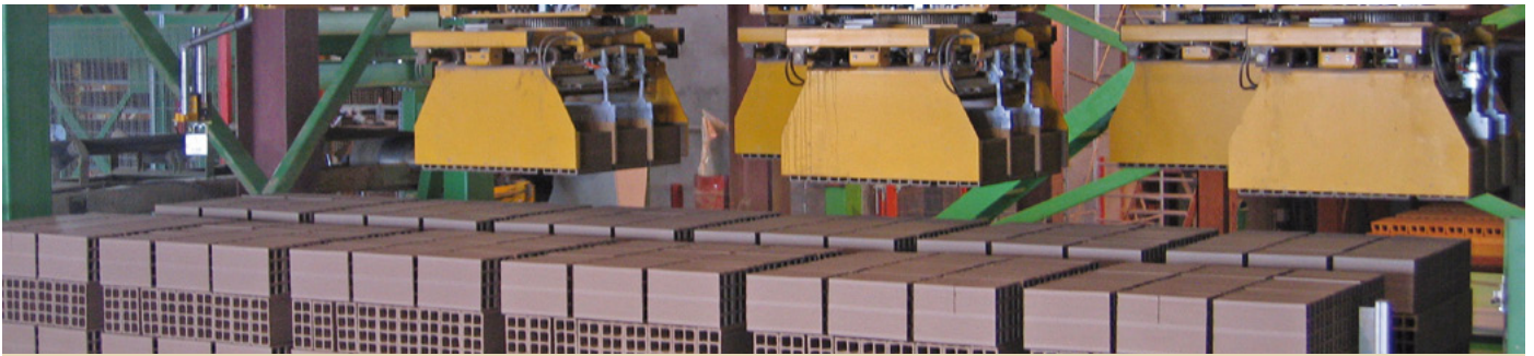
Pince d'empilage Setting gripper