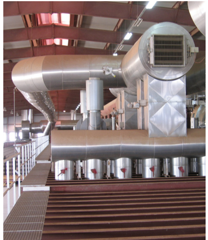
Récupération directe haute température Upper direct take-off system