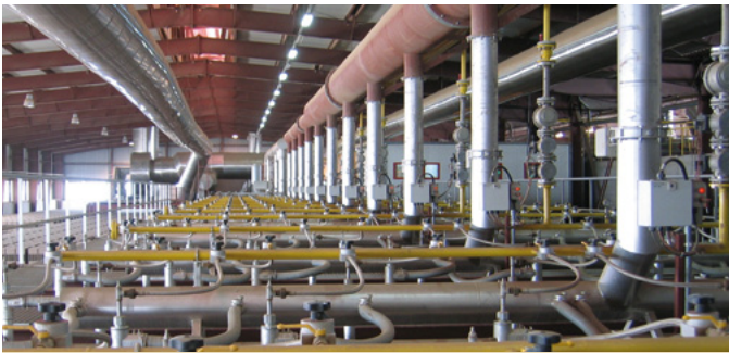
Installation chauffage à gaz Gas firing installation