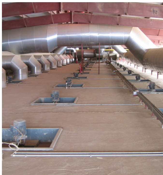
Séchoir continu équipé des ventilateurs tournants Continuous dryer equipped with rotary fans