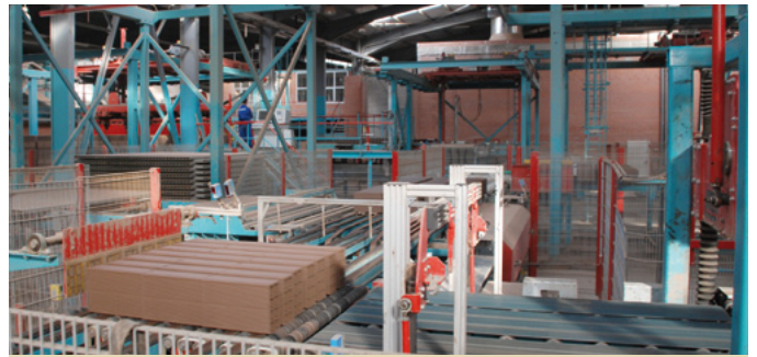
Circuit des produits verts, usine 2 Wet side, plant 2