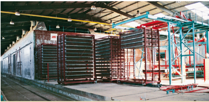
Séchoir avec 7 chambres doubles, usine 1 Dryer with 7 double chambers, plant 1