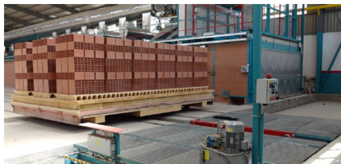
Premier wagon sorti du four le 1 er mai 2013, usine 3 First car out of kiln on 1 May 2013, plant 3