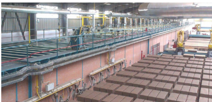
Four tunnel avec produits empilés, usine 3 Tunnel kiln with set products, plant 3