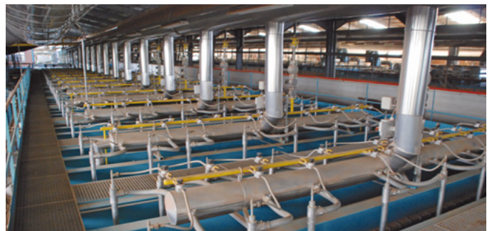
Four tunnel LINGL avec chauffage en voûte, usine 2 LINGL tunnel kiln with top firing, plant 2