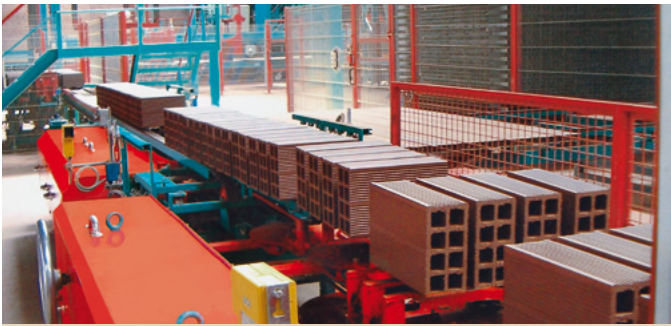
Dispositif de tournage après le coupeur, usine 1 Turning device after cutter, plant 1