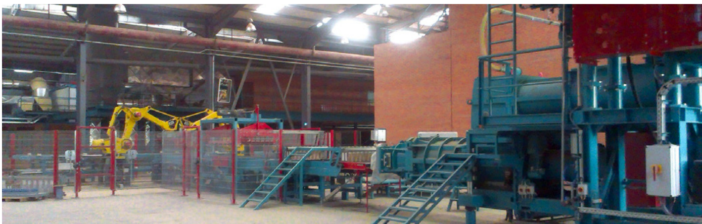
Circuit des produits verts, usine 3 Wet side, plant 3