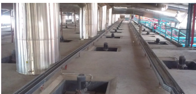
Séchoir, usine 3 Dryer, plant 3