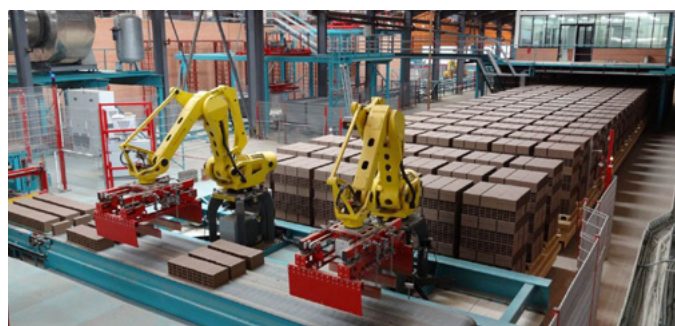
Installation d'empilage, usine 3 Setting installation, plant 3