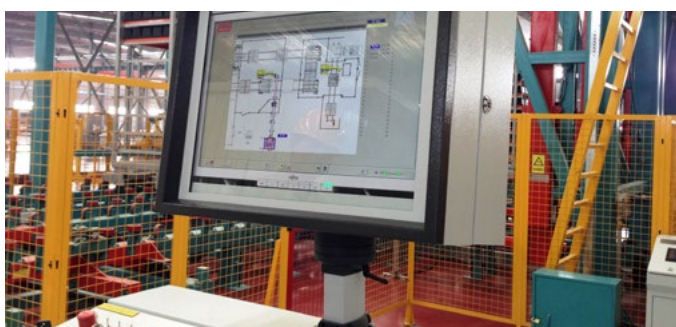
附中文接口的控制系统 Control panel with chinese interface