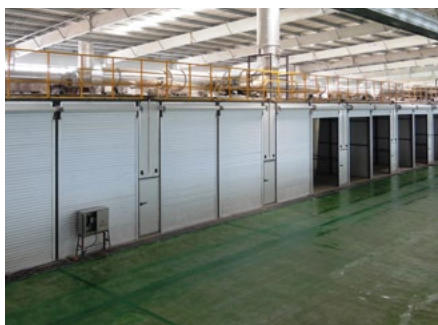
用于催化剂的室式干燥机 Chamber dryer for catalysts