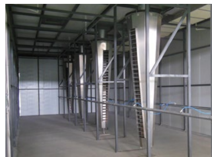
室式干燥机内部的旋转风机 View inside a chamber dryer with rotary fans