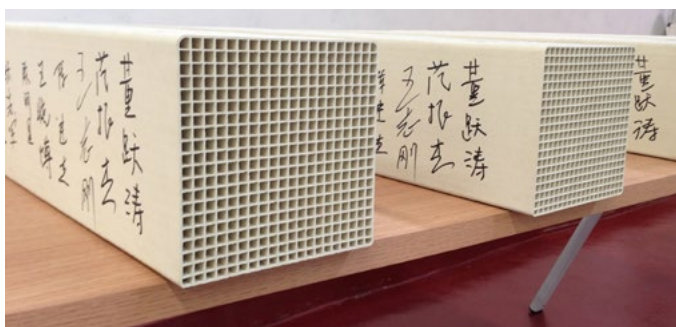
最先从新厂生产出来的催化剂 First catalysts out of the new plant