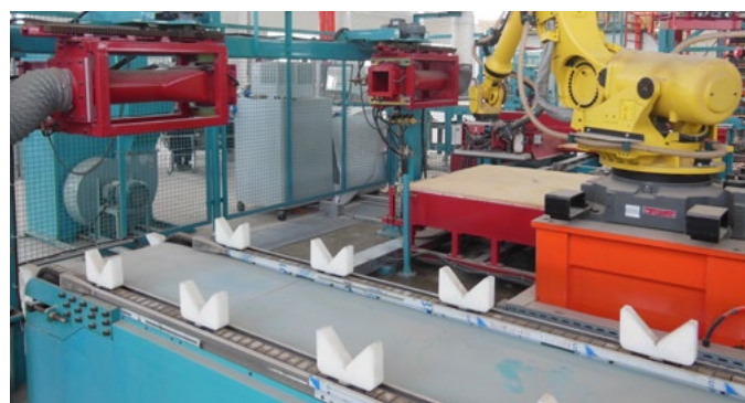
催化剂的自动修整 Automatic finishing of catalysts