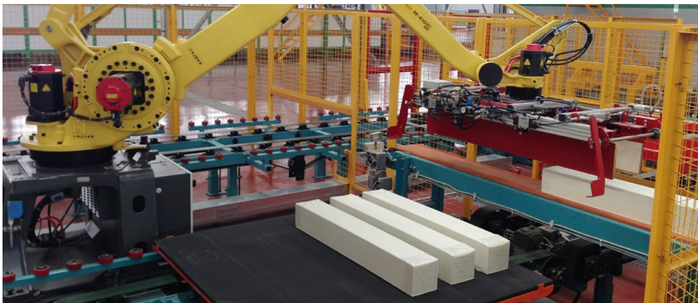
刚挤出的湿坯催化剂的托盘装载 Pallet loading with freshly extruded catalysts