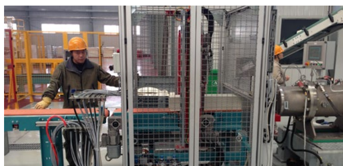
催化剂自动切割机 Automatic catalyst cutter