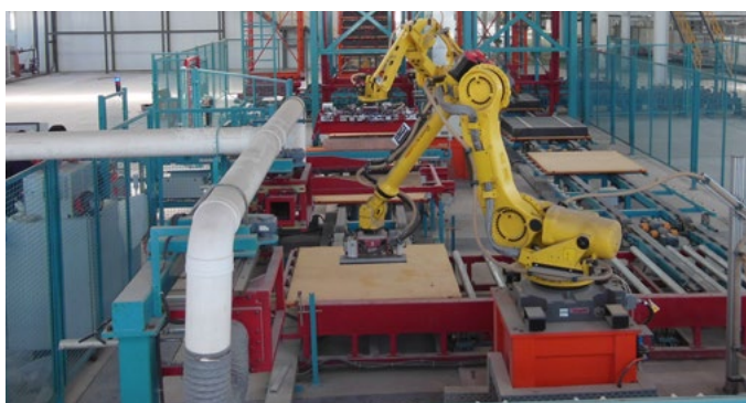
托盘卸载 Unloading of pallets