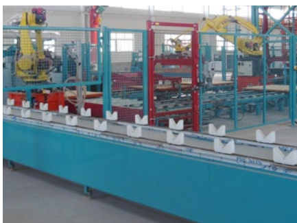
催化剂输送线 Catalyst conveyor