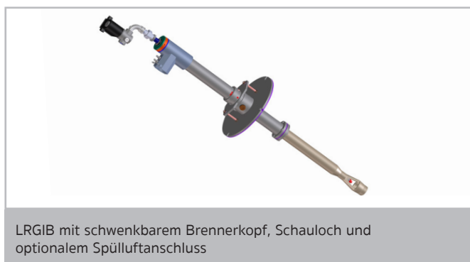
LRGIB mit schwenkbarem Brennerkopf, Schauloch und optionalem Spülluftanschluss