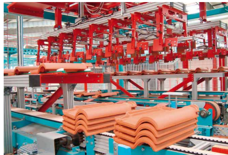
Formation of small packs Formation de mini-paquets

Uralita se fait au savoir-faire et à l'expérience de LINGL en qualité de partenaire de l'industrie de produits en terre cuite, internationalement reconnu. L'entreprise, située à Krumbach dans le sud de l'Allemagne, était entièrement responsable de la construction de l'usine clés en main, avec tout l'équipement depuis les machines après le