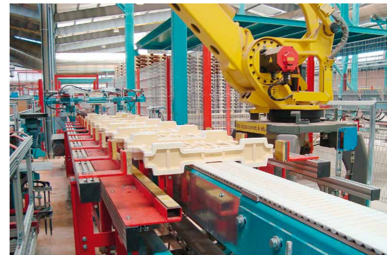
Alignment of cassettes Dispositif d'alignement des cassettes

ceram for a turn-key plant, including all foundations, with the complete equipment starting after shaping up to the packaging of packs ready for dispatch. LINGL would like to emphasize the high level of cooperation throughout the entire project between the Uralita/Lusoceram team and the LINGL staff, working together as one team with one target. This was certainly one of the key points for success.