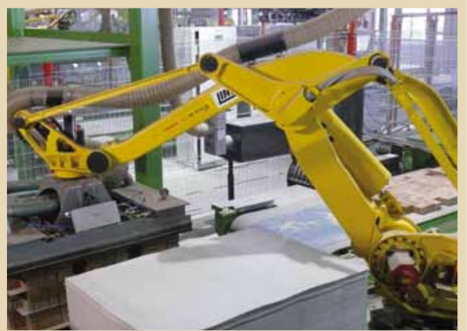
Versandpaketbildung Transport Pack Forming