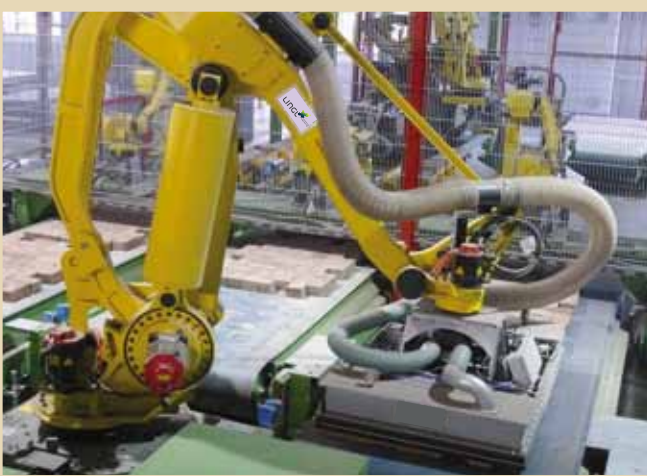
Sauggreifer Suction Gripper