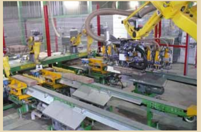
Gruppierlinien Grouping Conveyors