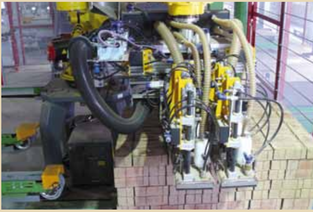
Ziegelpaketbereitstellung Brick Pack Feed